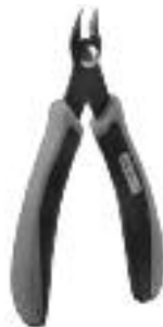
Art. Nr. 170688 SPEZIAL-SEITENSCHNEIDER

Vloeibare lijm in plastic-flacon met doseerbuisje om nauwkeurig te lijmen.